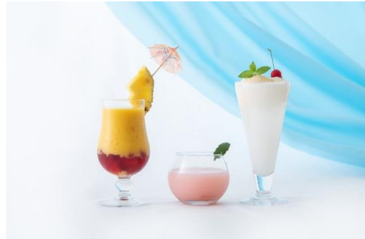
左から Sunset / Evening Sky / 雲