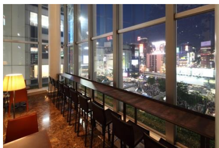
渋谷スクランブル交差点を見下ろせるカウンター席