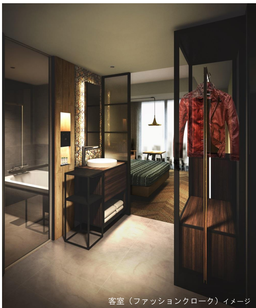
客室（ファッションクローク）イメージ

古き良きものをお洒落に、現代風アレンジした内装デザイン「ヴィンテージモダン」をコンセプトとした客室。ファッション文化の聖地である渋谷のアパレルショップをイメージしたワードローブ「ファッションクローク」をはじめ一点一点の家具にこだわり、クリエイターが住まう空間を表現しています。