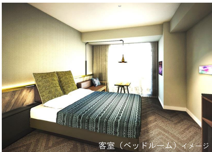
客室(ベッドルーム)イメージ