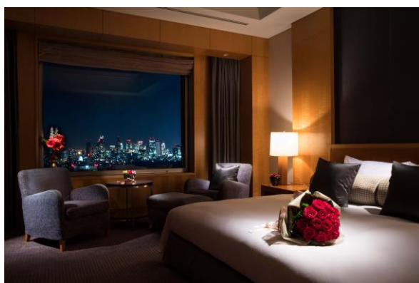
ロイヤルスイート ベッドルーム

セルリアンタワー東急ホテル(東京都渋谷区、総支配人：宮島芳明)では、バレンタインデーからホワイトデーのシーズンに合わせてスイートルームでの優雅なご滞在を提案する「Sweet Suite Stay Plan」を販売いたします。2018年2月1日(木)～3月14日(水)までのご宿泊で、価格はプレジデンシャルスイートまたはロイヤルスイート1泊220,000円～250,000円です。