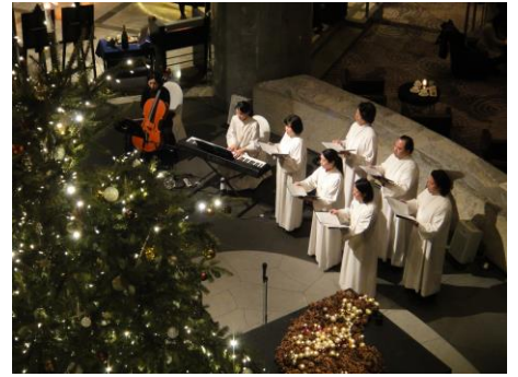
※いずれも過去の模様