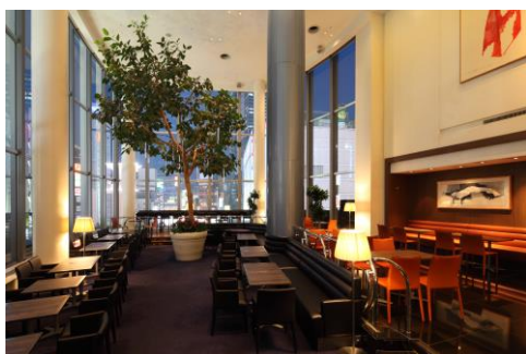
「エスタシオン カフェ」店内