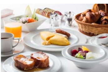
モーニングbuffetイメージ