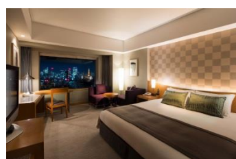
デラックスキングルーム