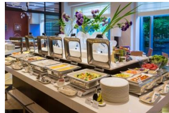
モーニングbuffetイメージ