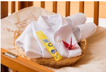
お子さま用アメニティ