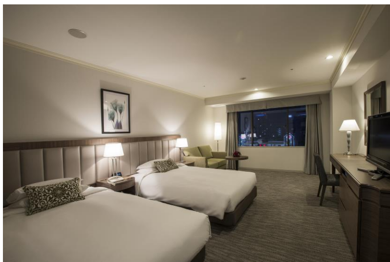
スーペリアツイン 31.5 m 2

また、ベッドサイドにはコンセント付きのナイトテーブル、お部屋全体を明るくする照明などビジネスマンからファミリー・女性のご旅行など、それぞれのお客様のニーズにきめ細かくお応えできる設えて快適な空間と寛ぎの時間をお約束いたします。