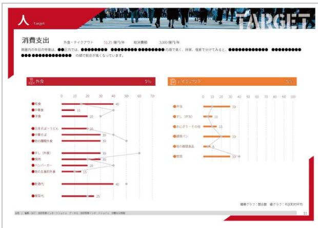
▲例:「人」消費特性ページ