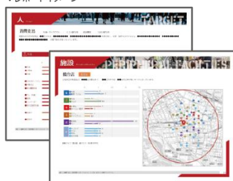
商圈情報レポート