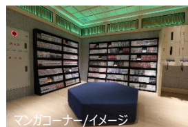
マンガコーナー/イメージ