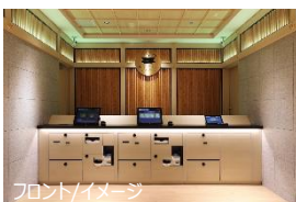
フロント/イメージ

最短 10 秒でチェックインが完了する「エクスプレスチェックイン」を導入しております。客室はツイン・ダブルタイプに加えて、スイートルームやベッドを 4 台設置した約 40 m 2 と広めの客室もございます。全客室に、衣類のしわやにおい・ウイルスを除去できるクリーニングマシン LG スタイラーを設置し、客室の水には世界中のアスリートから支持をうけるファイテン社のプレミアムな水「ファイテンウォーター」を採用いたしました。ロビーには無料でご利用いただける約 1,800 冊のマンガコーナー、スタッフを介することなくお客様のご都合にあわせて無料でお荷物を預けていただけるバゲッジポートを設置しております。