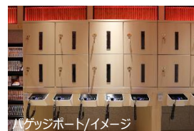
バゲッジポート/イメージ