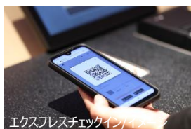
エクスプレスチェックイン/イメージ