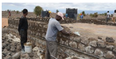
2022年7月 石を積み重ねセメントで固め壁造り。