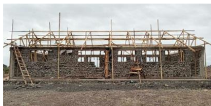
2022年8月 重機は使わず全て手作業の工事です。