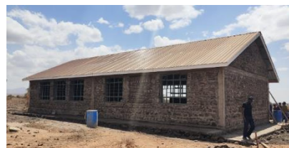
2022年9月21日 外観が完成し室内を整えました。