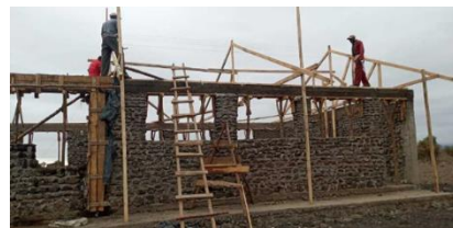
2022年8月 屋根づくりが開始しました。