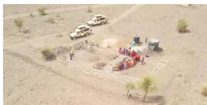
2022年7月 教室建設予定地は村のすぐそばです。