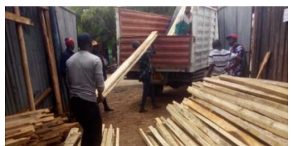
2022年7月 資材をマサイ村へ運びます。