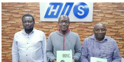
2022年6月30日 建設会社が決定しました。