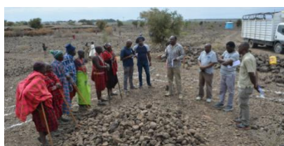
2022年7月8日 着工式が執り行われました。