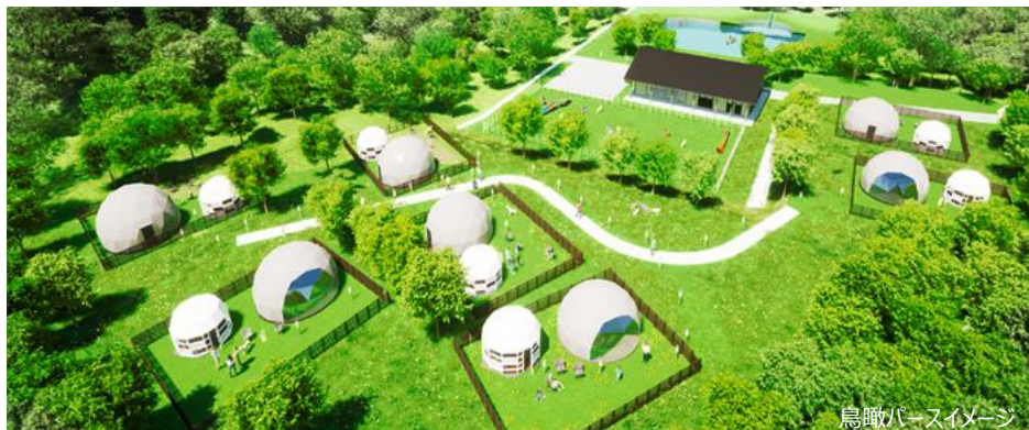
鳥瞰パースイメージ

株式会社エイチ・アイ・エス（本社：東京都港区 以下、HIS）は、北陸初となる、愛犬と一緒に過ごす専用のグランピング施設「GLAMHIDE WITH DOG KOMATSU」（読み方：グランハイド ウィズ ドッグ コマツ）を7月25日（月）よりソフトオープンし、本日より予約受付を開始します。HISがグランピング施設を運営するのは初となります。