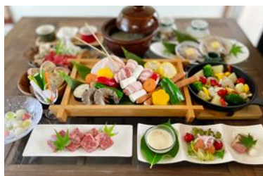
お食事イメージ 囲炉裏の炭火でお召し上がりいただけます。