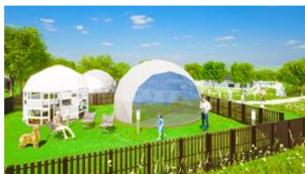
宿泊棟外観パースイメージ 常設のドームテント内は28.5㎡。広くて頑丈な造り。