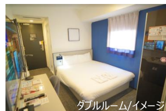
ダブルルーム/イメージ

HIS.H.H.は、変なホテル・ウォーターマークホテル・リゾートホテル久米アイランド・ヴィソ ン ホテルズ・満天ノ 辻のや・グリーンワールドホテル・ガムリーブホテル・ホテルインスピラ-S タシケントの 8 ブランドにて、日本・バリ島・台湾・ガム・ニューヨーク・ソウル・ウズベキスタンの 6 カ国 7 都市に全 42 施設を展開しております。ホテルを基点とした旅の楽しさ・ビジネスシーンでの利便性の実現のため、「繋がる・快適・先進的・遊び心・生産性」の 5 つをコアバリューとして追及し、生産性・効率性を掛け合わせ、お客様へよりリーズナブルに人生のスパイスとなるような楽しい体験を提供してまいります。