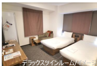
デラックスツインルーム/イメージ