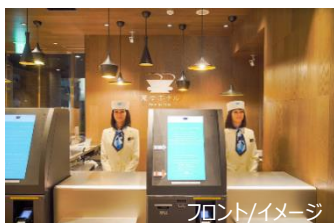
フロント/イメージ