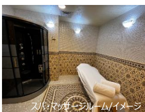
スパ・ジャグジー/イメージ