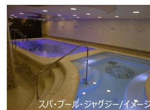
スパ・プール・ジャグジー/イメージ

HIS.H.H.では、中央アジアの中心都市として大規模な開発が進むウズベキスタンに注目し、世界遺産の多いウズベキスタンへの旅行需要・ヨーロッパや中欧諸国へのハブとしての宿泊需要を見込み、ホテル建設・運営を決定いたしました。ウズベキスタンと日本の交流のかけはしとなり、ウズベキスタンの旅行産業の発展に貢献してまいりたいと考えております。