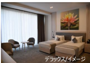
デラックス/イメージ