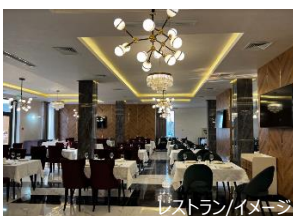
レストラン/イメージ