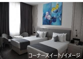
コーナースイート/イメージ