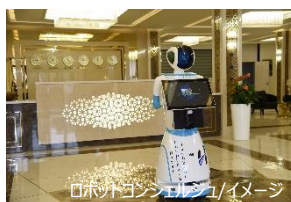
ロボットコンシェルジュ/イメージ