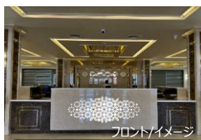
フロント/イメージ