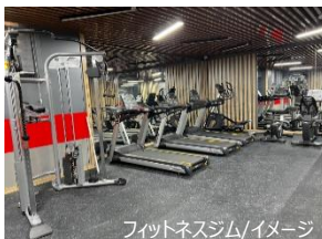
フィットネスジム/イメージ