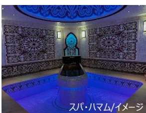
スパ・ハمام/イメージ