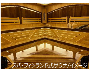
スパ・フィンランド式サウナ/イメージ