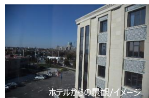
ホテルからの景観/イメージ