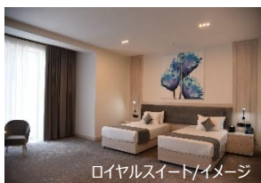
ロイヤルスイート/イメージ