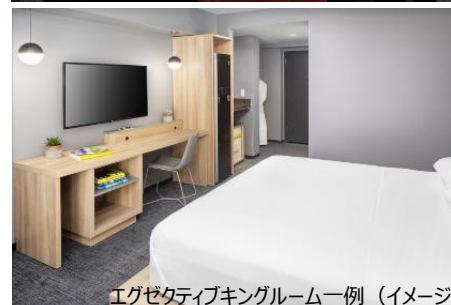
エグゼクティブキングルーム一例 (イメージ)