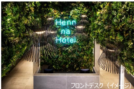
フロントデスク (イメージ)