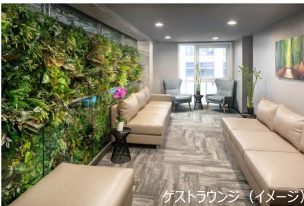
ゲストラウンジ (イメージ)