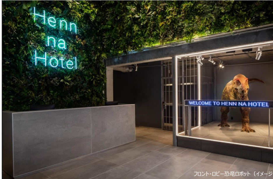
フロント・ロビー恐竜ロボット（イメージ）

H.I.S.ホテルホールディングス株式会社（本社：東京都港区）は、「変なホテル ニューヨーク」を2021年10月1日（金）に新規開業いたします。「変なホテル」の海外進出は韓国に続き2棟目、国内外あわせて21棟目となります。