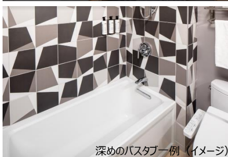
深めのバスタブ一例 (イメージ)