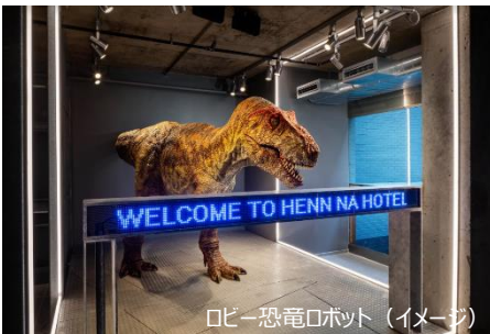
ロビー恐竜ロボット (イメージ)