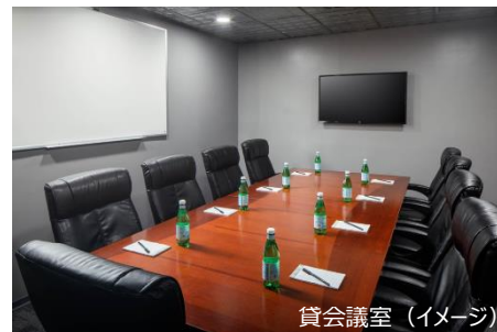
貸会議室 (イメージ)