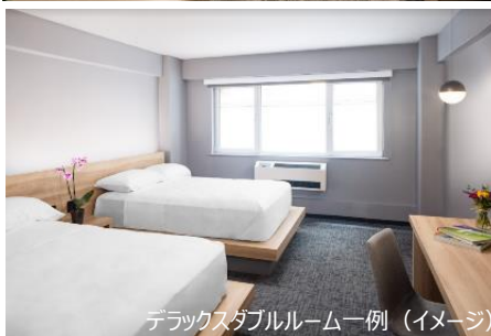
デラックスダブルルーム一例 (イメージ)