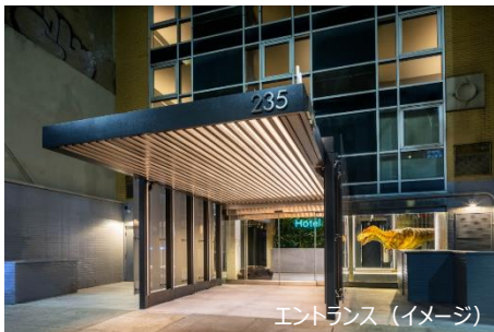
エントランス (イメージ)