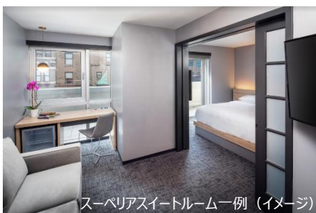
スーペリアスイートルーム一例 (イメージ)