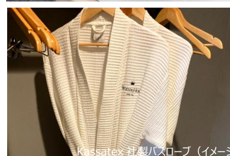
Kassatex 社製バスローブ (イメージ)