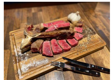
美蘭牛『福姫』イメージ

・Facebook： https://www.facebook.com/EZOIL.HOKKAIDO/