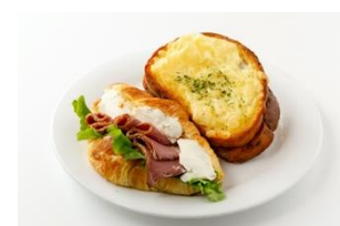
対象となる商品の一例 (パン類)

開始日：4月1日(木) 対象商品：デニッシュバー各種等 割引率：30% 運営会社：ジェイアール東海フードサービス ※デニッシュバーは2020年11月から実証実験での導入実績有り