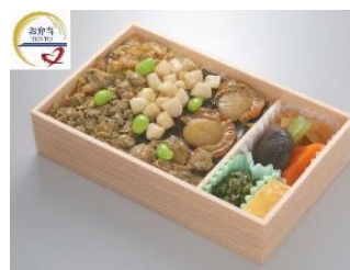
対象となる商品の一例 (駅弁類)

(1) おむすび処 米'n 八重洲南口店 導入場所：東京駅八重洲南口コンコース 営業時間：[通常] 6:30~22:00 [短縮] 6:30~14:00 ※3/26 現在 開始日：4月1日(木) 対象商品：駅弁・おにぎり等 割引率：50% 運営会社：ジェイアール東海パッセンジャーズ