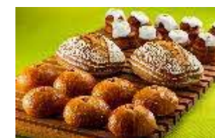
対象となる商品の一例 (パン類)

(3) 名古屋マリオットアソシアホテル ロビーラウンジ「シーナリー」 導入場所：名古屋マリオットアソシアホテル 15F 営業時間：11:00~19:00 開始日：4月1日(木) 対象商品：「シーナリー」内「ペストリーブティック」の パン・ポーションケーキ・焼き菓子 (テイクアウトのみ) 割引率：20%~40% 運営会社：ジェイアール東海ホテルズ