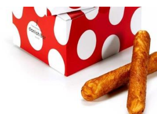
対象となる商品の一例 (パン類)

(2) デニッシュバー JR 名古屋駅店 マーメイドカフェ JR 名古屋駅店 導入場所：名古屋駅中央コンコース 営業時間：デニッシュバー 10:00~21:00 マーメイドカフェ [通常] 7:00~23:00 [短期] 7:00~21:00 ※3/26 現在