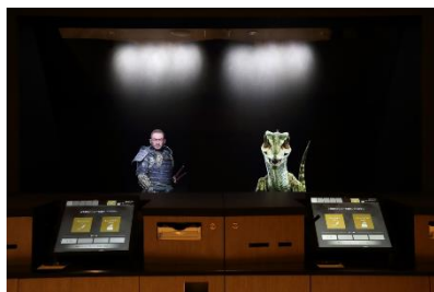
△フロント(イメージ)

奈良に因んだ山並み等の自然環境と文化遺産が一体となった歴史的風土を感じられ、「古都奈良」としての風格と魅力を創出しております。「歴史、伝統、文化」や「自然環境、眺望景観」そして、最新のテクノロジーと組み合わせる事で、心で感じる奈良の魅力を提供してまいります。さらに館内は、様々な新しい試みが多く詰まった最新鋭のホテルです。