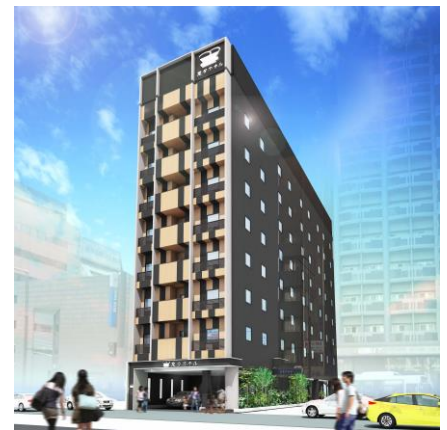
変なホテル福岡 博多（外観イメージ）

エントランスの壁一面から1階フロア全体を映像プロジェクションと恐竜ロボットによるエンタテインメント性の高い演出により、今までにない楽しい宿泊体験を提供いたします。