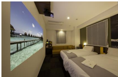
変なホテル初の「シアタールーム」が誕生(シアタールームは70室完備)