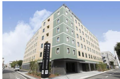
北棟、南棟からなる総客室200室。変なホテル客室最大を誇ります。(外観イメージ)