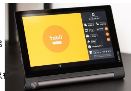
Tabii:館内外の情報収集と照明、空調、TV等のあらゆる客室機器との連動をすることができます。