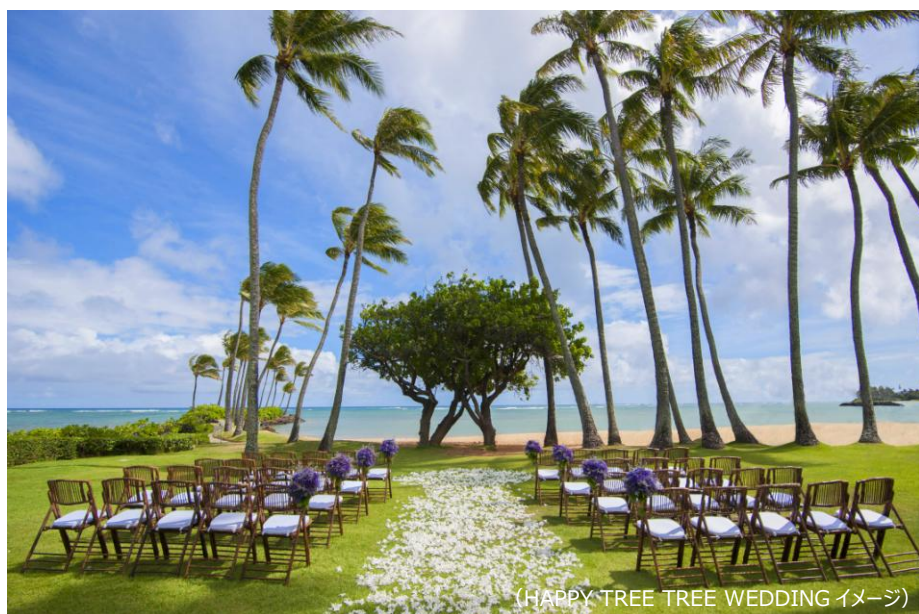
(HAPPY TREE TREE WEDDING イメージ)

※1：ゼクシィ 海外ウェディング調査 2016年調べ ※2：厚生労働省人口動態統計月報年計(概数) 平成27年 ※3リクルート調べ