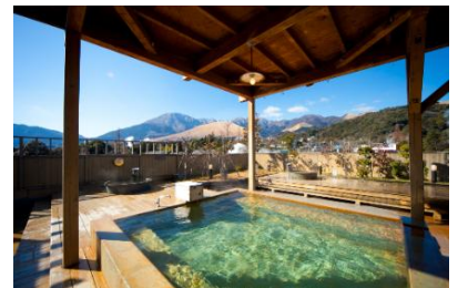
別府温泉 おにやまホテル 露天風呂（イメージ）