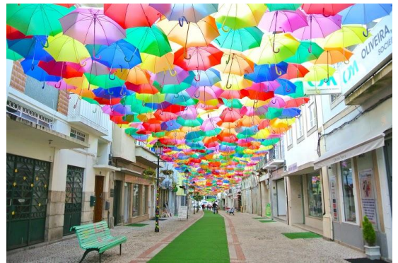
(ポルトガル アゲダ イメージ)

6月のテーマである「色いろいろな旅」にあわせた世界のカラフルな街並み、イベントや、地球の大自然が織り成す色など写真集・書籍を幅氏に選書いただき特設コーナーを設置します。また、店内では期間限定で「アンブレラ・スカイ・プロジェクト produced by 田島知華(たじはる)」を展開し、ポルトガルの小さな街アゲダ (Agueda) をイメージしたレイアウトでお出迎えいたします。ポルトガルのアゲダでは、灼熱の太陽が照りつける夏の空にカラフルな傘でうめつくされますが、H.I.S.旅と本と珈琲とでは、カラフルな Caetla(サエラ)の傘で鮮やかに彩ります。