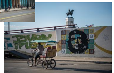
ハバナ、バラデロ(イメージ)