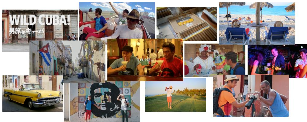
キューバパンフレット・動画（イメージ）

WILD CUBA! : http://www.his-j.com/tyo/special/cuba/