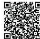
(アンケート QR コード) (対象パンフレット)

みんなでオトク! グループ割 として、4 名以上のグループなら代表者 1 万円割引、6 名以上のグループなら代表者 1.5 万円引となります。その他、アンケートに答えて 500 円引き且つ抽選で 100 名様に現地で使える 1 万円のおこづかいをプレゼントも行ってあります。