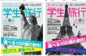
(対象パンフレット)