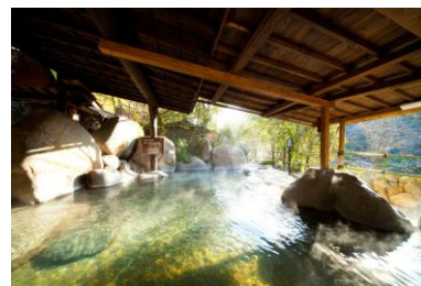
天ヶ瀬温泉 山荘天水/イメージ

羽田空港から大分空港に到着後、別府港の南に位置する「日出（ひじ）町」では日出城三ノ丸跡に立つ「的山荘」にて、地域で獲れた新鮮な海の幸を使った割烹料理をご用意しております。豪華な近代和風建築の日本家屋で極上の美食を堪能していただけます。ご宿泊はさまざまな全国温泉ランキングでも常に上位に位置づけられる「由布院」で、御三家宿と呼ばれる宿のうち、お好きな宿にご宿泊していただけます。それぞれに個性がある宿で洗練された上質のおもてなしをご堪能していただけます。