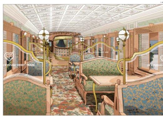
「 」 / 或る列車（イメージ）