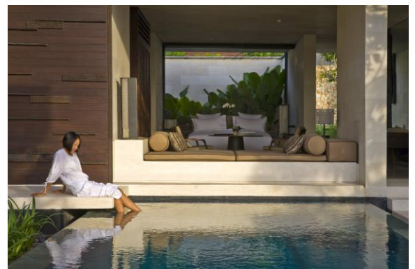
アリラ・ヴィラズ・ウルワツ 1 ベッドルームヴィラ (客室一例)

☆ H.I.S. バリ支店 (クタ店・バリ店・ウブド店) が日本語で 24 時間安心の旅をサポートします