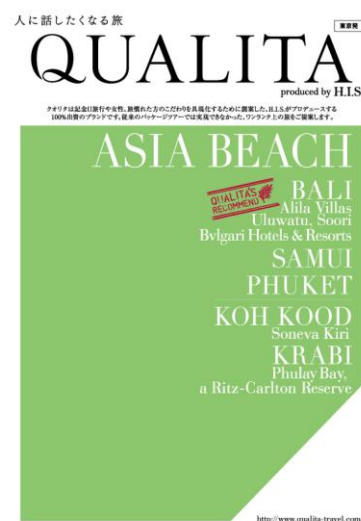
QUALITA パンフレット表紙