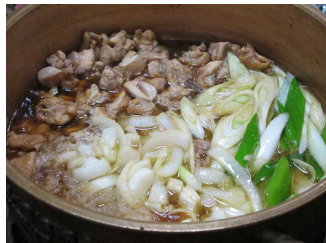
(ちゃんこ鍋 イメージ)