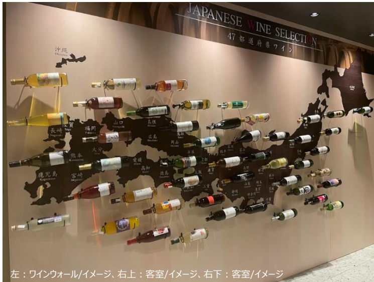
左：ワインウォール/イメージ、右上：客室/イメージ、右下：客室/イメージ

H.I.S.ホテルホールディングス株式会社（本社：東京都港区）が運営する、ウォーターマークホテル京都と変なホテル 奈良は10月1日（日）でオープン3周年を迎えました。そこで、ウォーターマークホテル京都では、日本初、日本全国47都道府県のご当地ワインをご用意した「ワインルーム」を10月5日（木）より発売し、変なホテル 奈良では、宿泊券などが当たる3周年記念イベントを10月9日（月）～10月31日（火）の平日に毎日実施いたします。