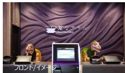
フロント/イメージ

詳細は公式ホームページをご参照ください。 https://www.hennnahotel.com/kyoto-hachijoguchi/