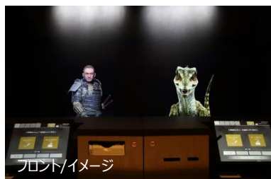
フロント/イメージ

詳細は公式ホームページをご参照ください。 https://www.hennnahotel.com/nara/