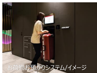
お荷物お預かりシステム/イメージ