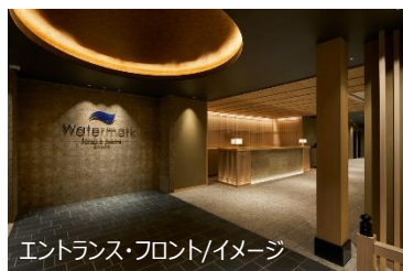
エントランス・フロント/イメージ