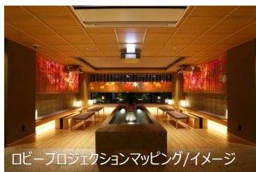
ロビープロジェクションマッピング/イメージ