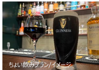
ちよい飲みプラン/イメージ