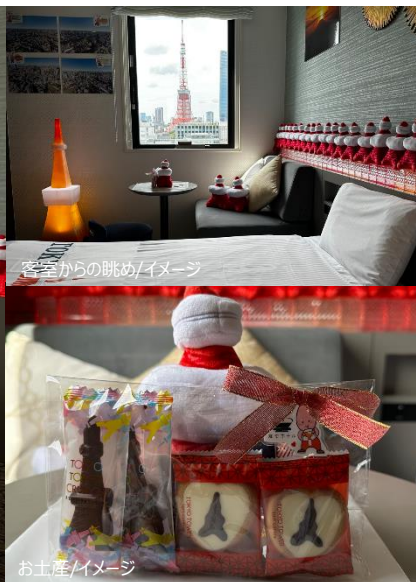
客室からの眺め/イメージ