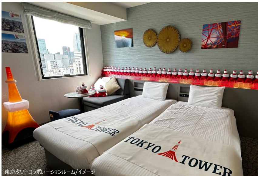
東京タワーコラボレーションルーム/イメージ

H.I.S.ホテルホールディングス株式会社（本社：東京都港区）が運営する変なホテル東京 浜松町は、今年の12月23日（土）に開業65周年を迎える東京タワーを運営する、株式会社TOKYO TOWER（本社：東京都港区）とコラボレーションした「東京タワーコラボレーションルーム」を9月12日（火）より発売いたします。