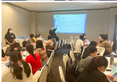
写真：研修中の様子