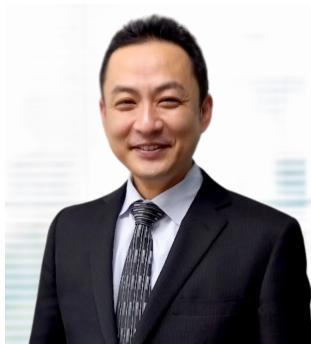
石原 純 (Jun Ishihara)