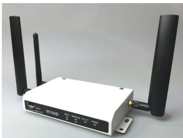
上：展示イメージ（商品:IoT/M2Mルータ）

本展示では、これらソリューションの海外販売を念頭にグローバルモデルを開発・展示し、Systema America Inc.によるプレゼンテーションを実施いたします。その他、システナのクラウド型Webデータベース（Canbus）、金融機関で実績のあるセキュアブラウザ（Web Shelter®）といった多くのIT製品・サービスをご紹介させていただきます。