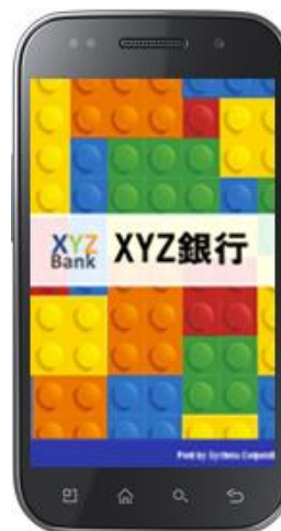
上：展示イメージ（商品:Web Shelter®）