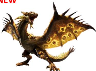
リオレイア希少種モデル