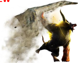
激昂したラージャンモデル