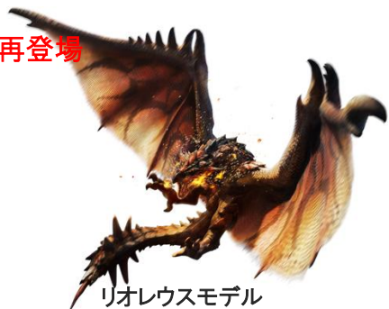
リオレウスモデル