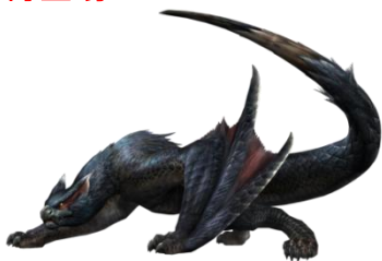
ナルガクルガモデル