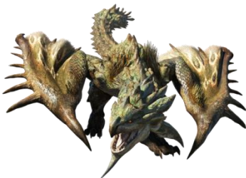
リオレイアモデル