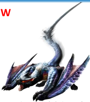
ナルガクルガ希少種モデル