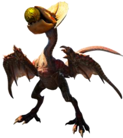
イャンクックモデル