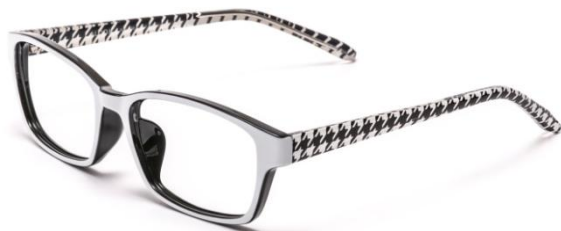
●ALF-006 CDR (千鳥格子)