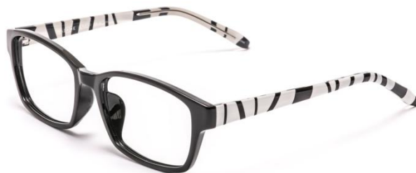
●ALF-006 RNDM (ランダム)