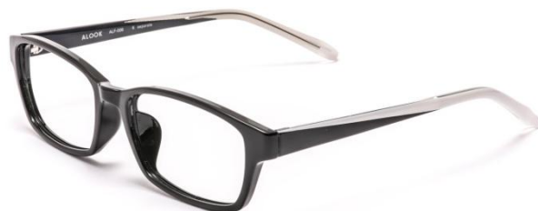
●ALF-006 SPRT (セパレート)