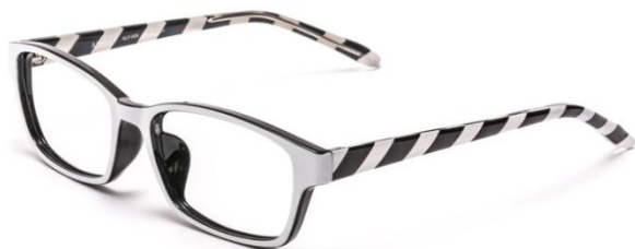
●ALF-006 STRP (ストライプ)