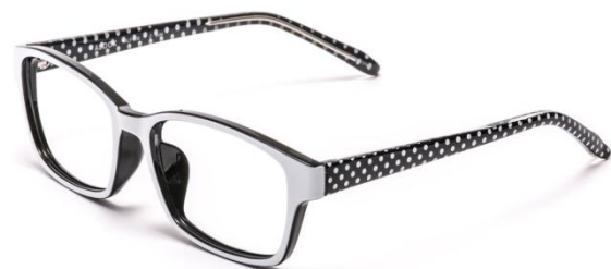
●ALF-006 DOT (ドット)