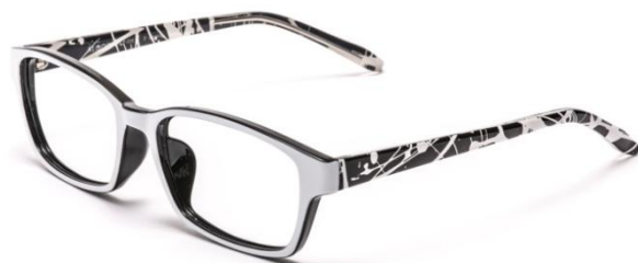
●ALF-006 DRP (ドロップング)