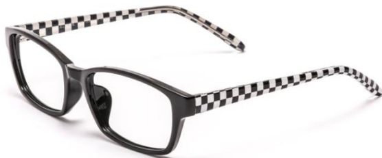
●ALF-006 ICMT (市松)