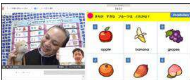
：実際のレッスンの様子

当社のオンラインとスクールシステムを活用して楽しみながら英語が身につく「ヒューマンアカデミーランゲージスクール」のノウハウやそのほか多様な子ども向け教育コンテンツをいかながら、当社の関連会社である「産経ヒューマンラーニング」の中学・高校への英語オンラインレッスンの実績（首都圏私立中高におけるシェアNo.1）を組み合わせ、小学生以下のお子さま向けの英語教育支援として「キッズトライアルレッスン」を開発いたしました。