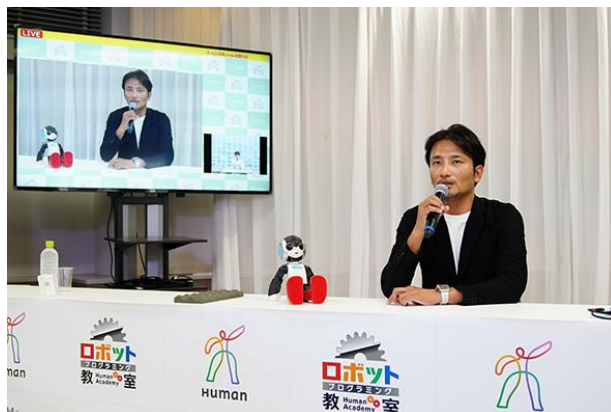
▲発表後に行われた講演の様子