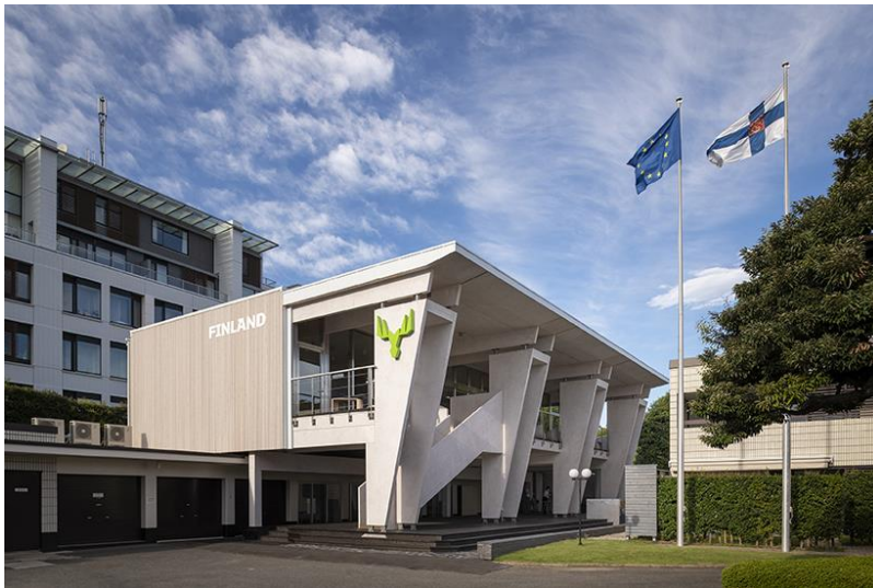
PA Asikainen for Business Finland

Business Finland は、2021 年に開催予定の東京 2020 オリンピック・パラリンピックに向けて、フィンランド大使館敷地内にある、フィンランド・ナショナル・パートナーハウス「Home of Finland」にて一般の方に向けた見学ツアーを開催することを発表します。本ツアーは、オリンピック・パラリンピック期間中、フィンランドのデザイン、木造建築、サステナブルな取り組みなどを紹介し、東京を訪れる旅行者や東京の皆さんに向けて穏やかで幸せに過ごす時間をご提供するとともに、フィンランド代表選手からのメッセージや選手のユニフォームの展示のほか、ポストカードキャンペーンを実施するなど、オリンピック・パラリンピックにちなんだコンテンツを展開します。