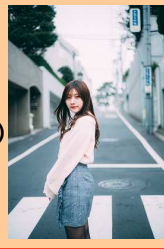
元HKT48 山田麻莉奈 (声優)