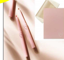
「WHOMEET」 マルチライナー 2本& 金沢「箔」 オイルコントロールペーパー