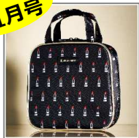
「アルティザン・アンド・アーティスト」 リップ柄スクエアポーチ