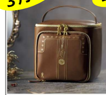
「ロベルタ ディ カメリーノ」 ドレッサーボックス