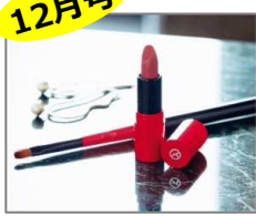
「ジョルジオ アルマーニ ビューティ」 ミニリップと「& ROSY」オリジナル 上質リップブラシ