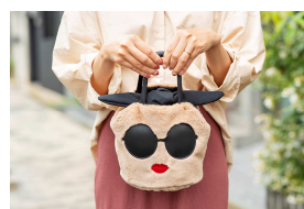
ちょうど良いサイズ感