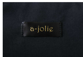
ブランド公式タグをオン