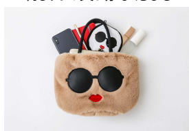
見た目以上の大容量