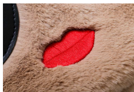
刺しゅうの真っ赤なくちびる