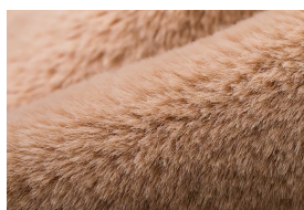
ふわっふわのエコファー生地