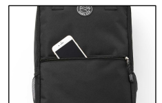
④フロントポケット