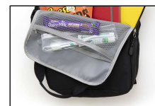
③メッシュポケット（内側）