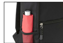
⑦メッシュポケット（サイド）