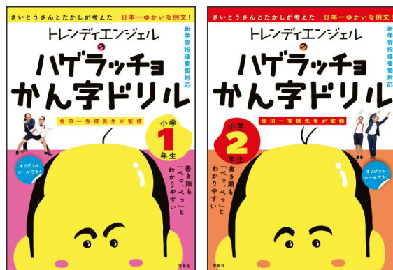
『トレンドイエエンジェルのハゲラッチョかん字ドリル 小学1年生』(左) 『トレンドイエエンジェルのハゲラッチョかん字ドリル 小学2年生』(右) 【発売日】2018年3月26日 【定価(各)】本体980円+税

本書は、「はげ」自体をバカにしたり、差別する意図は持っていません。お子様の不適切な言動を助長するものでもありません。