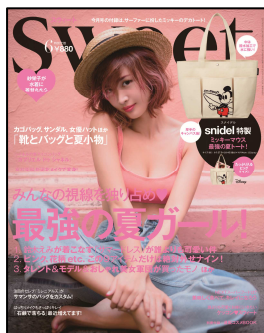
『sweet』 毎月12日 発売