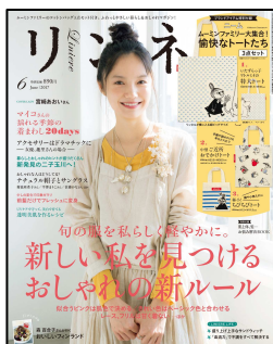
『リンネル』 毎月20日 発売