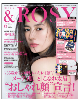
『& ROSY』 毎月23日 発売