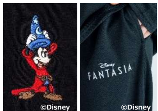
②トップスの刺しゅう パンツの刺しゅう