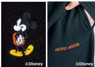
①トップスの刺しゅう パンツの刺しゅう