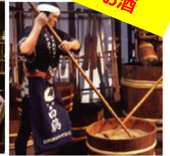
白鶴酒造資料館 (兵庫)