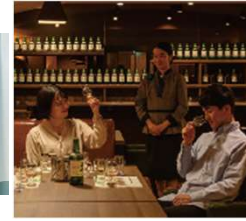
サントリー白州蒸溜所 (山梨)