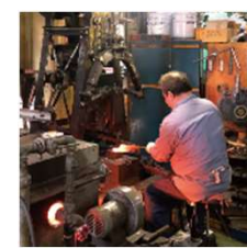
包丁工房タダフサ ファクトリーショップ (新潟)