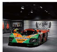
マツダミュージアム (広島)