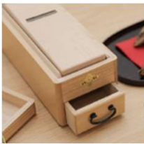
味の素グループ うま味体験館 (神奈川)