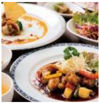
黒酢の郷 楠志田 (鹿児島)