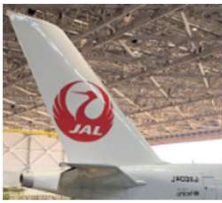
JAL工場見学 SKY MUSEUM (東京)