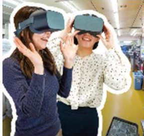
白い恋人パーク (北海道)