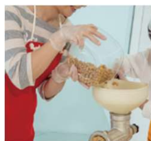
ハナマルキ みそ作り体験館 (長野)