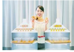
麒麟ビール横浜工場 (神奈川)