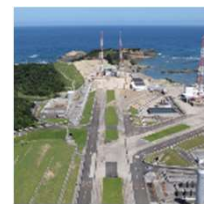
JAXA 種子島 宇宙センター (鹿児島)