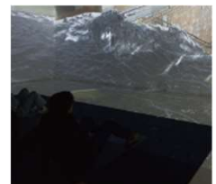
津波・高潮ステーション (大阪)