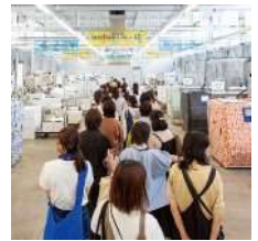
Mt factory tour (岡山)

燕三条の職人技から食品サンプル、 年に1回開催の文具女子には堪らない マスキングテープ製造工場も。