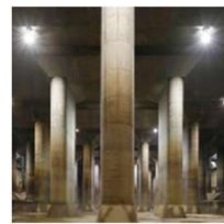
首都圏外郭放水路 (埼玉)