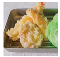
元祖食品サンプル屋 (東京)