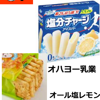
オハヨー乳業 オール塩レモン