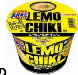
スーパーカップ「レモチキ塩ラーメン」