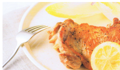
カリカリチキンソテー レモン風味