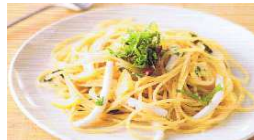
イカと大葉のペペロンチーノ