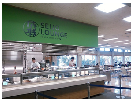
成城大学内学食「学生ラウンジ」

メニュー：『syunkon カフェごはん1~3』の中から約20種のレシピをセレクト。通常のメニューとは別に、日替わり、週替わりで2~3品『syunkon カフェごはん』メニューを提供。