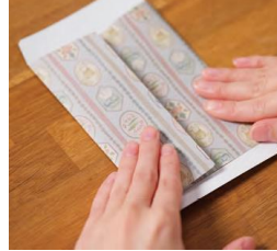
⑤テープのりで貼る