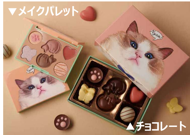
『Mary's 猫のチョコレートみたいなメイクアップパレットBOOK』 発売日：2024年1月23日／価格：2992円(税込)