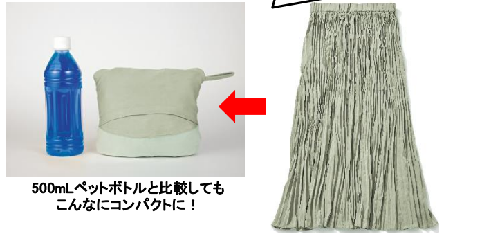
プリーツスカート[ピスタチオ、チャコール、ブラックの3色展開]各 ¥4,389

ポケットにスカートの本体が収納できるポケットブル仕様。ワッシャープリーツ生地でお洒落なのにシワが目立ちにくい！旅行や出張、急なデートにも◎。