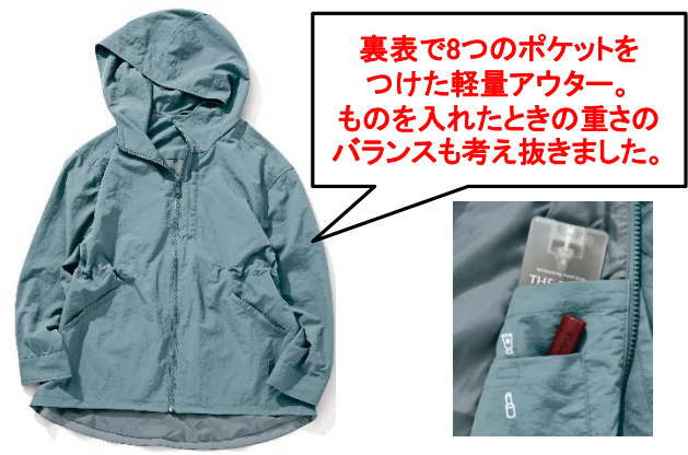
アウター[ブルー、チャコールの2色展開]各 ¥6,589