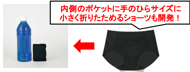
ショーツ[ブラック、ピンク、ベージュの3色展開]各 ¥1,419