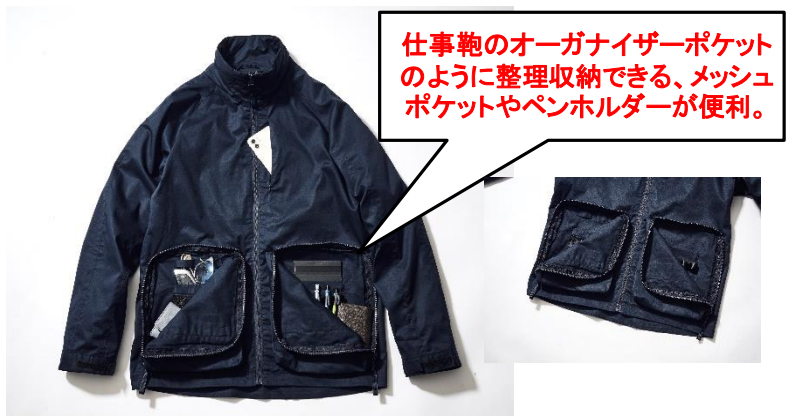
アウタージャケット[ネイビー、ブラックの2色展開]各 ¥9,889