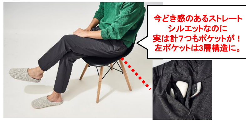
パンツ[グレー、ベージュ、ブラックの3色展開] ¥4,389