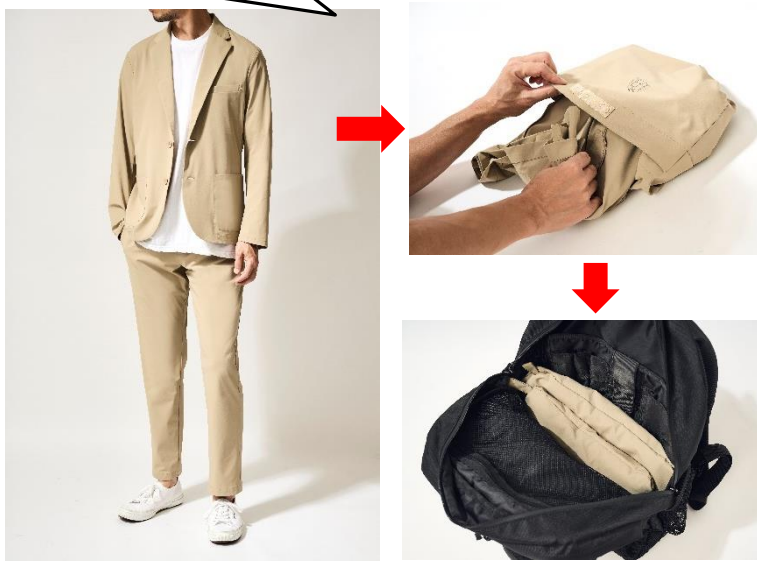
ジャケット[ベージュ、ネイビーの2色展開]各 ¥5,489 パンツ[ベージュ、ネイビーの2色展開]各 ¥4,389

軽量で伸縮性に優れた2つボタンジャケットとパンツのセットアップ。簡単にしまえる収納ポケットに入れば上下セットアップがバックパックにすっぽり！